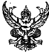
ขนาดตัวครุฑสูง ๓ เซนติเมตร